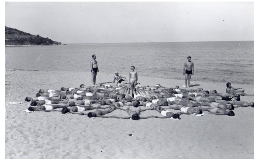
Ученици от Климатичното училище на Софийското училищно настоятелство по време на занятия на плажа, 1934 г.