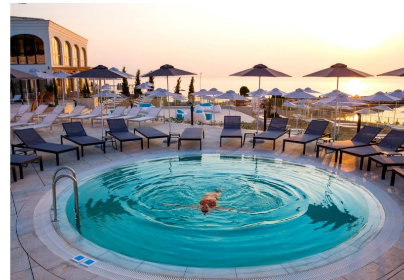
Изгрев край Термален комплекс „Аквахаус Термал & Бийч“, 2017 г.